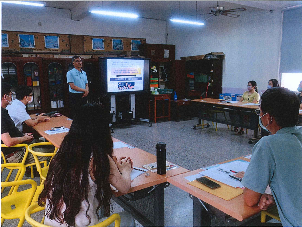
文字說明：彭校長說明為何學校要做家庭教育的必要性。