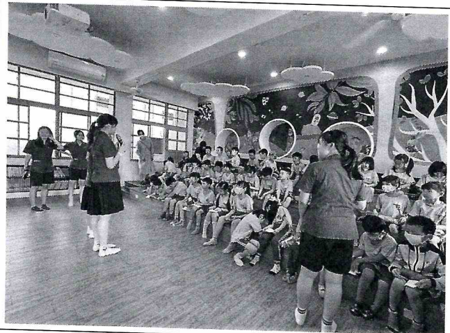
說明：112-2 臺中女中姐姐志工說故事