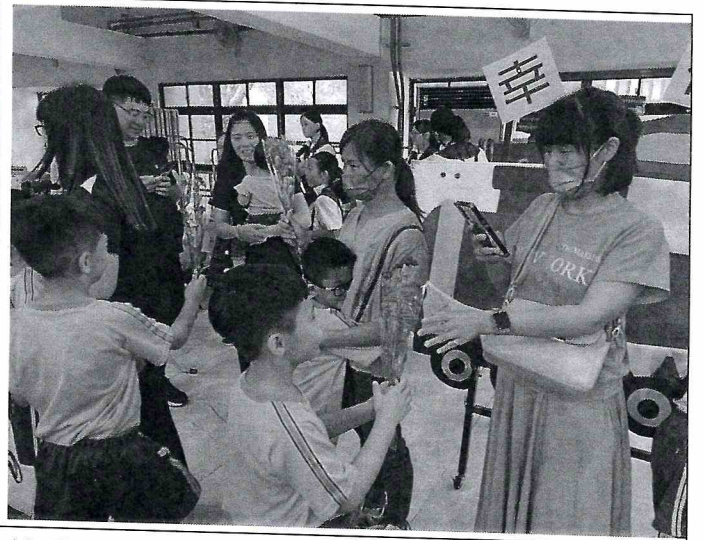
說明：母親節慶祝活動。