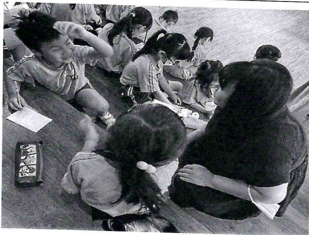
說明：112-2 家長志工家庭教育說故事