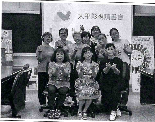
說明：112-2 親師家庭教育影視讀書會